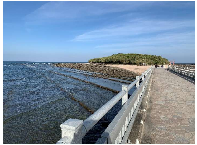
写真 4. 道路状況確認ついでの青島神社