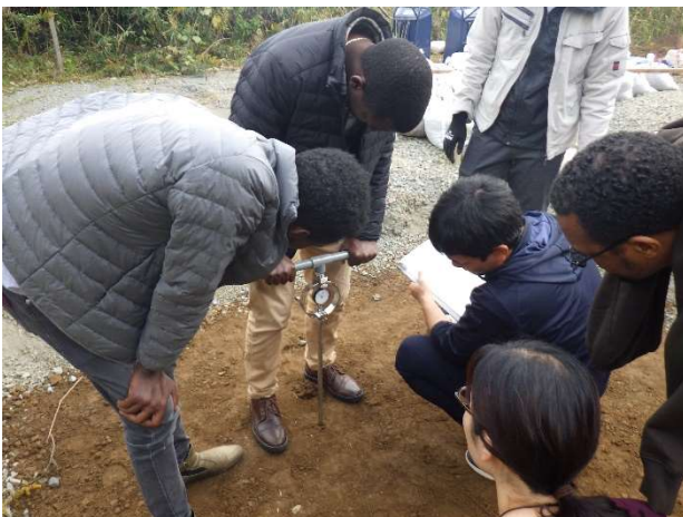
写真 1. ポータブルコーン貫入試験