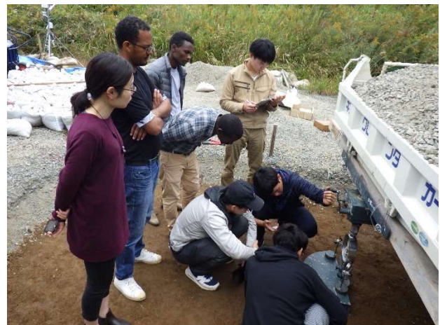
写真 2. 現場 CBR 試験